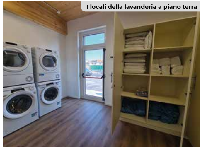
I locali della lavanderia a piano terra

Oltre alle panchine e a un'area arredata per l'accoglienza, sono state predisposte tre vasche botaniche per coltivare essenze, piante aromatiche e un piccolo orto, anche con la finalità di ampliare i progetti dedicati agli ospiti. Completa gli arredi esterni un impianto di illuminazione per garantire maggiore sicurezza anche durante le ore notturne. L'intervento, avviato nel 2024, è finanziato da fondi PNRR