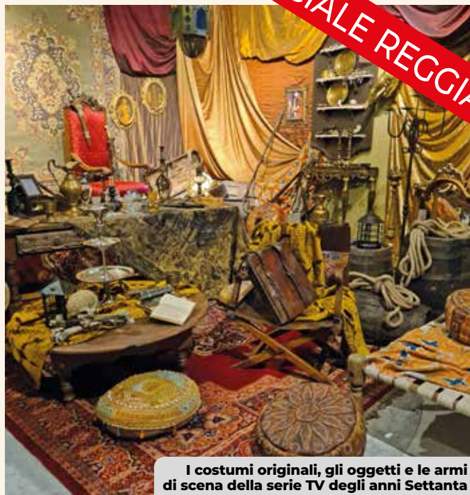
I costumi originali, gli oggetti e le armi di scena della serie TV degli anni Settanta

Numerosi gli appuntamenti nei pomeriggi di sabato e domenica fino alla fine di giugno: laboratori di disegno e rilegatura