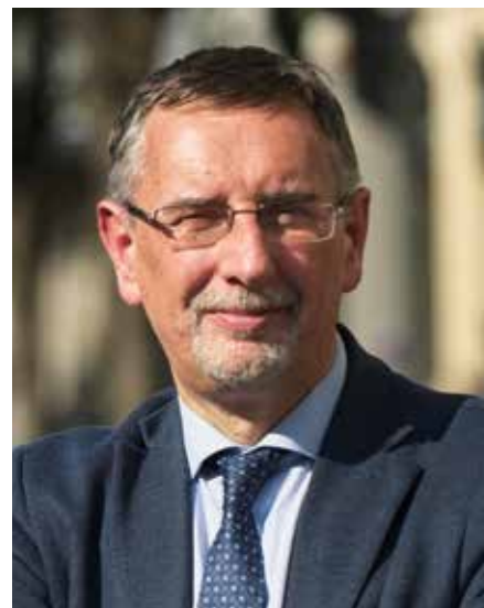
PAOLO PILOTTO | Sindaco di Monza

In queste ultime settimane sono numerosi i luoghi di Monza che, tolti i ponteggi di cantiere, svelano il loro nuovo volto. Altri si preparano a farlo nel giro di qualche mese. Il risultato, agli occhi di un osservatore attento, è quello di vedere progressivamente la città che, un passo alla volta, si rinnova e cresce.