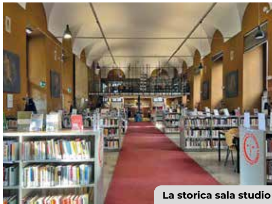
La storica sala studio

Ospiteranno aree tematiche dedicate e divanetti confortevoli, pensati per favorire la lettura rilassata e