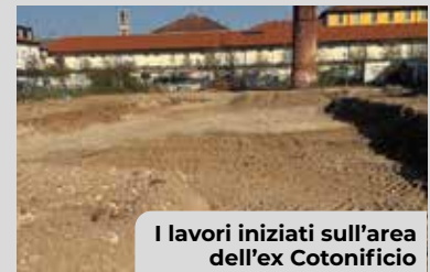
I lavori iniziati sull'area dell'ex Cotonificio

Sta sorgendo sull'area dismessa dell'ex Cotonificio la nuova biblioteca, che si estende su una superficie di circa di 1000 mq , analogamente alla storica Biblioteca Civica. Il progetto prevede la suddivisione degli spazi interni in isole tematiche, salottini lettura, emeroteca e spazio ristoro . Saranno inoltre presenti aree destinate ai bambini e ai ragazzi, complete di spazi accessori. La biblioteca offrirà anche una sala studio, un'area adolescenti e «make lab», spazi dove utenti di tutte le età possono «imparare facendo», sperimentare e condividere conoscenze . L'opera ha un valore di circa 2 milioni di euro : completano il progetto un'area verde pubblica con percorsi pedonali e un'area per il parking pubblico .