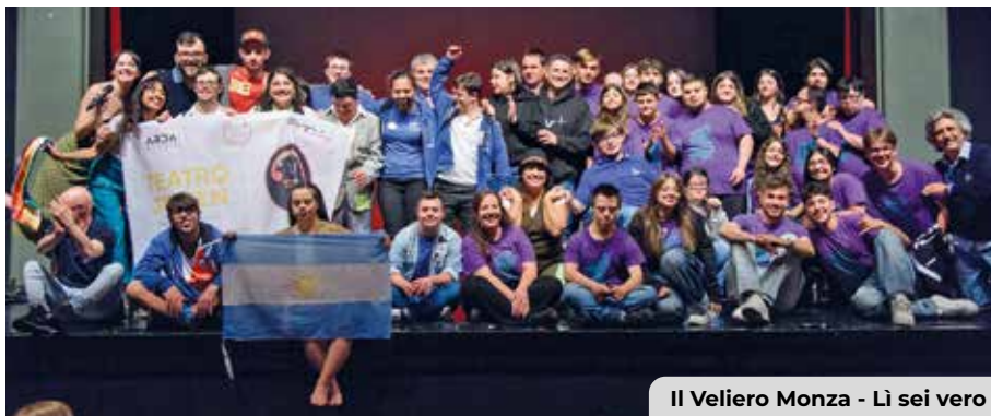
Il Veliero Monza - Lì sei vero