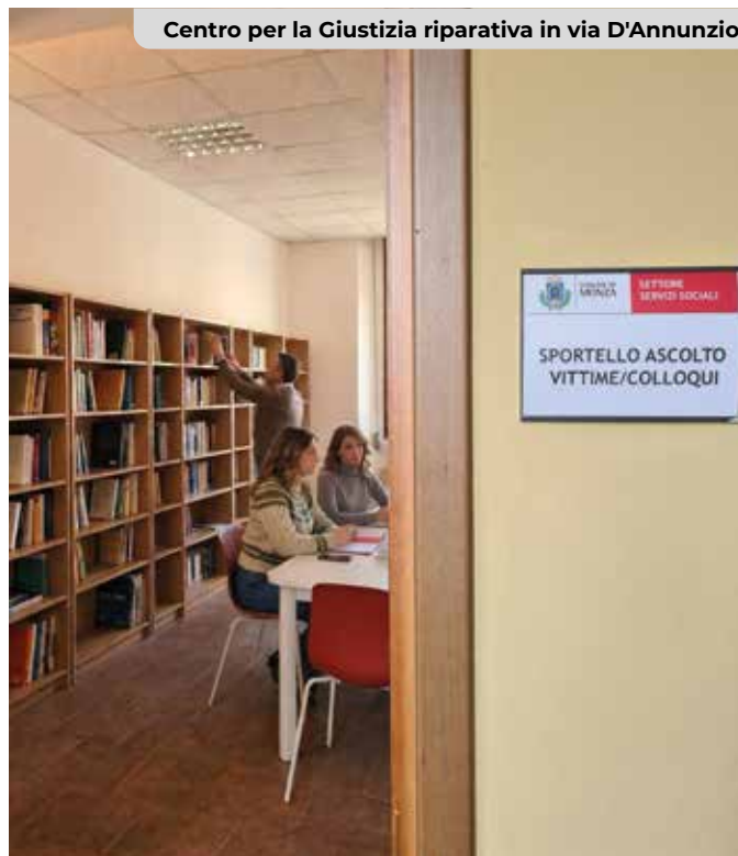
Centro per la Giustizia riparativa in via D'Annunzio

a livello nazionale nello sviluppo della giustizia riparativa. L'iniziativa rappresenta un passo significativo verso una giustizia più attenta alle persone, capace di integrare la dimensione giuridica con quella sociale e relazionale.