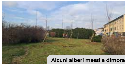
Alcuni alberi messi a dimora

tati più di 300 alberi, 1000 arbusti e 250 impianti forestali . L'Associazione Bella Jajo ha contribuito con la donazione di 50 alberi e oltre 700 arbusti, tutti piantati all'interno del parco di via Calatafimi . In occasione della Giornata Nazionale dell'Albero, varie Associazioni hanno contribuito alla messa a dimora di nuovi alberi in diversi quartieri.