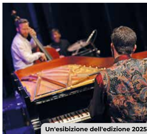
Un'esibizione dell'edizione 2025

L' 8 maggio alle 21 nella chiesa di San Pietro Martire , Il mio cuore trema propone inni sacri, melodie popolari, antiche ninne nanne armene per cullare il mondo. Tre piccoli concerti e una visita guidata alla scoperta del Memoriale di Umberto I, visto con gli occhi della Regina Margherita il 10 maggio , alle 10.30, 11.15, 12 nella Cripta della Cappella Espiatoria . Santa Maria al Carrobiolo ospita lunedì 11 alle 21 Natural Mystic , una preghiera Barbarica e Rastafariana