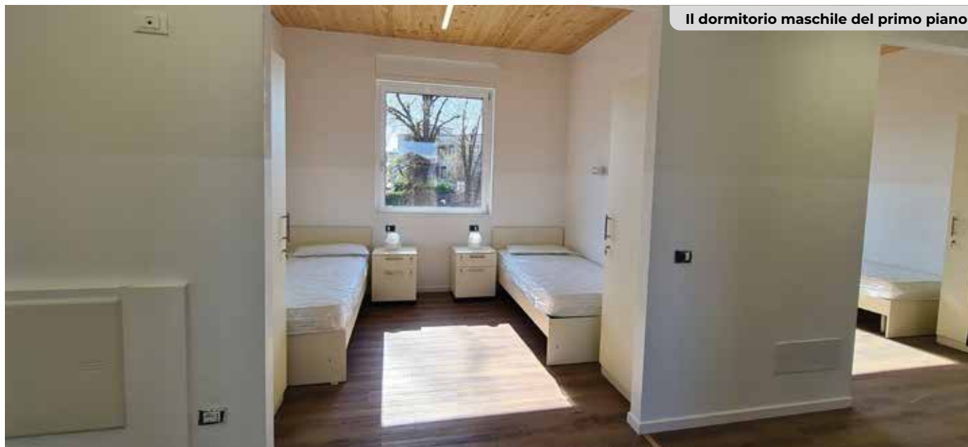
Il dormitorio maschile del primo piano