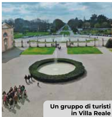
Un gruppo di turisti in Villa Reale

Se il momento di massima concentrazione giornaliera di SIM rilevate si è verificato il 7 settembre con 212.202 presenze , come prevedibile in coincidenza con il Gran Premio d'Italia di Formula 1 , l'intero periodo dal 4 al 7 settembre, in contemporanea con «Monza Fuori GP», ha visto un totale di 774.089 presenze. Altri eventi rilevanti sono stati l' ACI Racing Weekend 2 (24-26 ottobre,