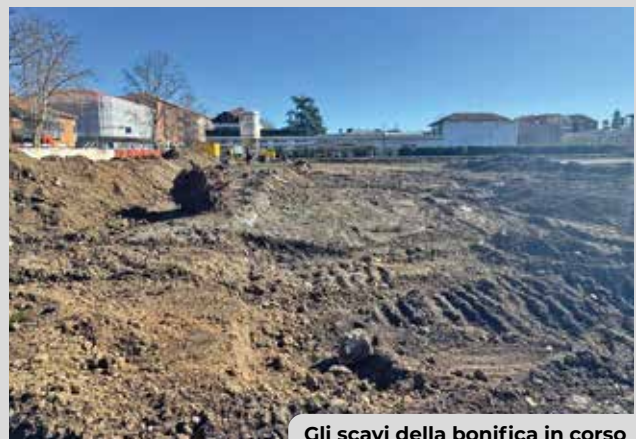
Gli scavi della bonifica in corso