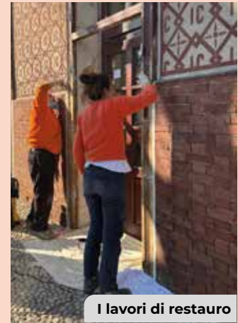
I lavori di restauro

I lavori, concordati con la Soprintendenza, sono ormai a buon punto e anche il Teatrino di Cederna si prepara finalmente a riaprire i battenti, dopo il recupero e il restauro. Questo storico luogo risalente ai primi anni del XX secolo, sorto all'interno del complesso industriale dell'ex Cottonificio, si prepara a diventare un presidio culturale stabile . Per rendere vivace e costante la proposta di spettacolo, l'Amministrazione Comunale siglerà un accordo di collaborazione con CTM - Compagnie Teatrali Monzese , che riunisce le compagnie teatrali amatoriali in città e che coinvolge annualmente circa 200 volontari tra attori, registi, tecnici e operatori culturali.