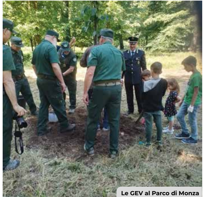
Le GEV al Parco di Monza

Alle 9.30 l'appuntamento è nell'area parcheggio dietro al bar Cavigra per l'accoglienza dei partecipanti, seguita dall'esperienza a bordo del trenino panoramico del Parco con approfondimenti su flora, fauna e cascine storiche; seguono i laboratori educativi, dedicati al riciclo creativo e alla biodiversità. La giornata si concluderà alle 16.30.