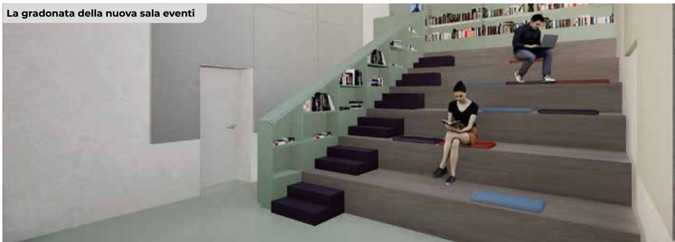
La gradonata della nuova sala eventi