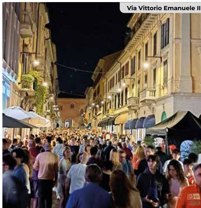
Via Vittorio Emanuele II

432.056 presenti), l' International GT OPEN (17-19 ottobre, 421.358 ) e il Festival del Parco (26-28 settembre, 408.416 ). Il minimo stagionale è stato invece registrato il 31 dicembre con 90.389 persone.