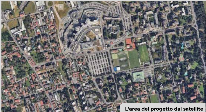
L'area del progetto dal satellite

colazione e gestire l'impatto dei flussi di attraversamento;