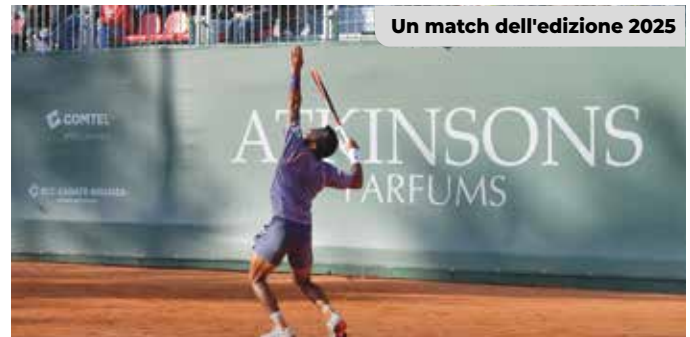
Un match dell'edizione 2025

segreteria@villarealetennis.it - 039.2310584