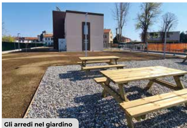
Gli arredi nel giardino

La struttura è completa di pannelli fotovoltaici per la produzione di energia rinnovabile e di un sistema di riscaldamento a pavimento alimentato da pompe di calore