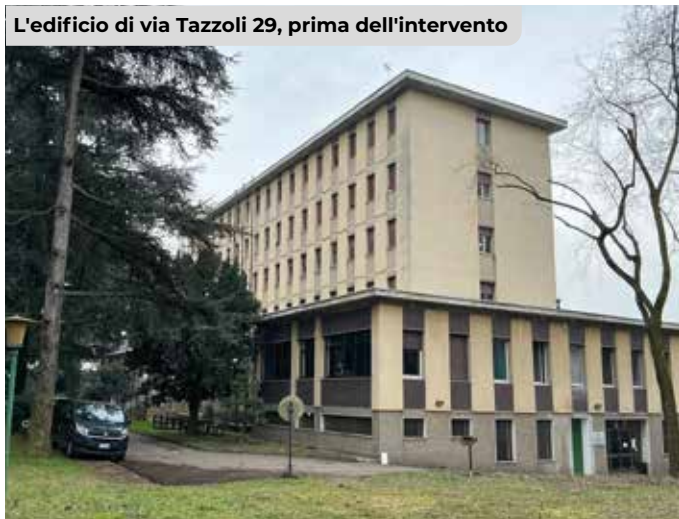
L'edificio di via Tazzoli 29, prima dell'intervento