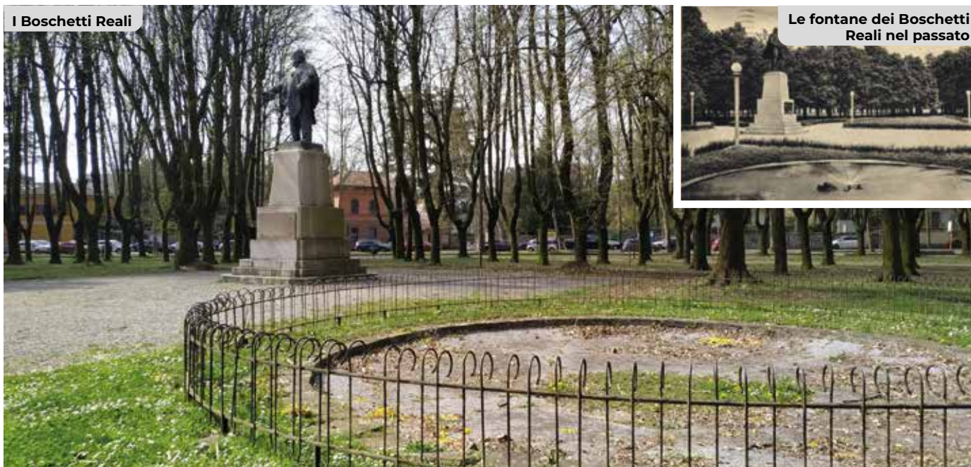
Le fontane dei Boschetti Reali nel passato