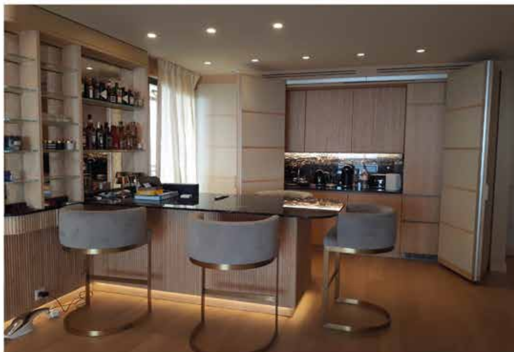
_casacontemporanea _casatradizionale _lab _design _materiali