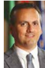
Villa Simone capogruppo