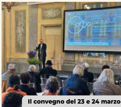
Il convegno del 23 e 24 marzo

Lo scorso 23 e 24 marzo ha preso il via nel Salone d'Onore della Villa Reale di Monza, trasformato per l'occasione nel Salone della Trinamica, il ciclo convegni promosso nell'ambito di UR-RA - Unity of Religions - Responsibility of Art, la mostra dedicata all'opera e alla ricerca spirituale di Michelangelo Pistoletto e visibile fino al 31 ottobre 2026.